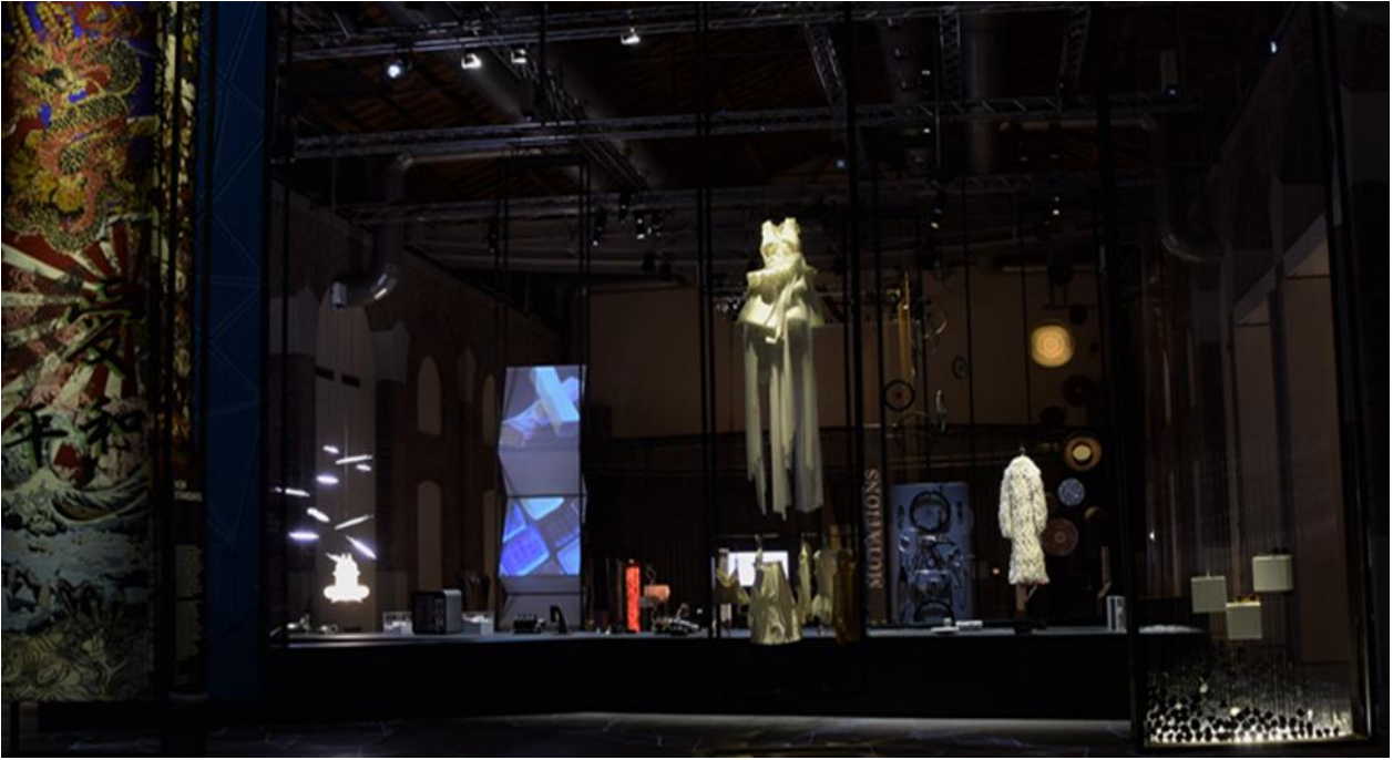
Abito prodotto da Pier&co per la mostra "New Craft" in occasione della XXI Triennale Internazionale di Milano